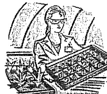
Invernadero Vivero, Cultivar Pasto

Favor de escribir todos los nombres de los niños que viven en la casa (menores de 22 años)