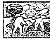
Cultivation, Preparation of soil