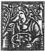
Harvest (fruit and vegetables)