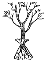
Árboles Podar, Plantar, Derribar o Cortar