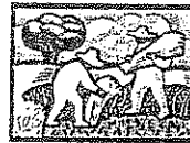
Cultivando, Preparación de Tierra