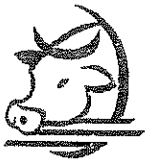
Ganado, Procesando, Empacando

¿Alguien de su familia ha trabajado en algo relacionado con los siguientes empleos? Si No