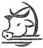
Feed Cattle, Processing, Packing

Has anyone in your family worked in anything related to the jobs listed below? Yes No