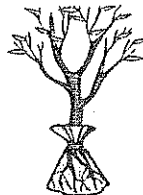
Trees Planting, Cutting