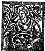
Cosechando (frutas y verduras)